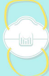
แบบมีวาล์วระบายอากาศ