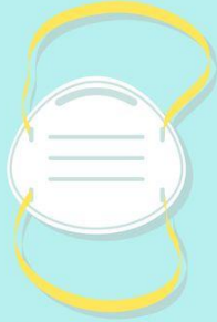
แบบไม่มีวาล์วระบายอากาศ